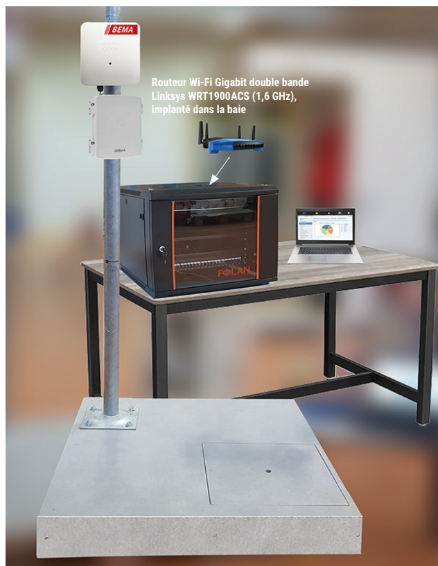
Routeur Wi-Fi Gigabit double bande Linksys WRT1900ACS (1,6 GHz), implanté dans la baie